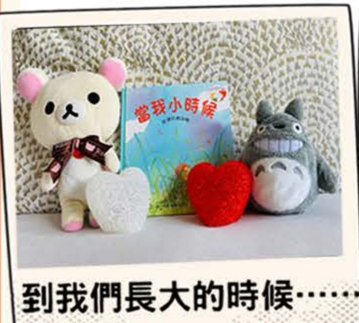
到我們長大的時候……