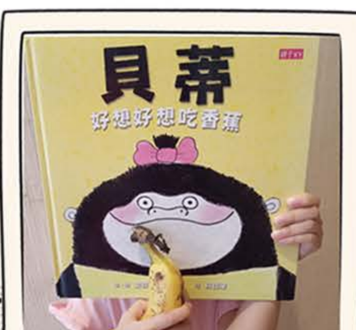
孩子，我們一起嘗試吧！